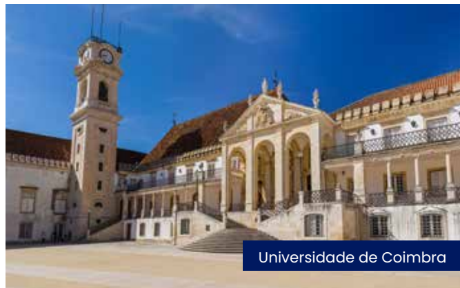
Universidade de Coimbra

Após o café da manhã no hotel, encontro com o coordenador e guia local onde pela manhã, faremos uma visita à icônica Biblioteca Joanina, uma das bibliotecas barrocas mais impressionantes do mundo, localizada na histórica Universidade de Coimbra (ingresso incluído). Na sequência, experiência típica com passeio em Barca Serrana pelo Rio Mondego, apreciando as paisagens da região enquanto desfrutamos de um lanche a bordo (ingresso incluído). Almoço livre para aproveitarem o ritmo da cidade e suas sugestões gastronômicas. À tarde, saída para uma visita leve a uma das charmosas vilas medievais da região, Lousã ou Penela, ambas conhecidas por sua beleza histórica, castelos e atmosfera pitoresca e que fazem parte das Aldeias de Xisto de Portugal, pequenas vilas completamente construídas com xisto. Retorno a Coimbra para hospedagem e noite livre.