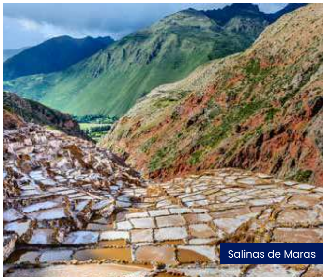
Salinas de Maras

• 4º Dia - 08 de Novembro de 2026 - Domingo